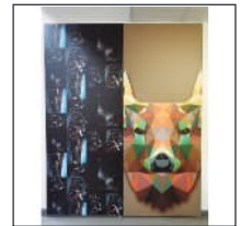
Spannrahmen Digitaldruck | Retaining frame digital print