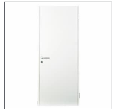
Tür weiß | door white

Zuschläge nach Ablauf der Bestellfrist: 20 % ab 6 Wochen vor Veranstaltungsbeginn, 35 % ab Aufbaubeginn (0120)