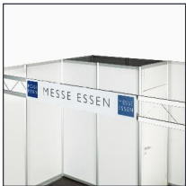
Blendenelement | Screen element

!!!These services cannot be combined with system stands from our partner Messe Projekt!!!