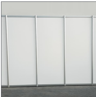
Wand weiß | System wall white