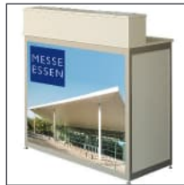
Digitaldruck Infotheke | Digital printing infocounter