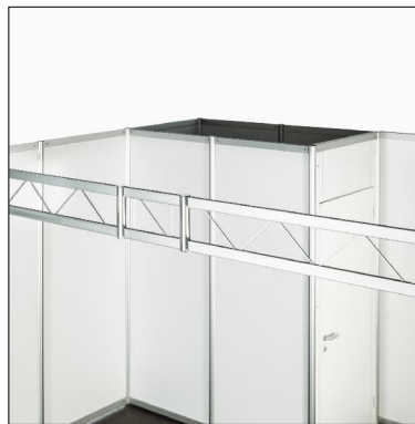
Gitterträger | Grid support